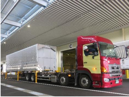
トラック到着後 コンテナを脱着