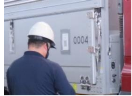
コンテナの QR コードと運行表の QR コードをスマートフォン専用アプリでペアリングし、出発