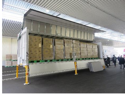
別のコンテナは荷主による荷積みが完了